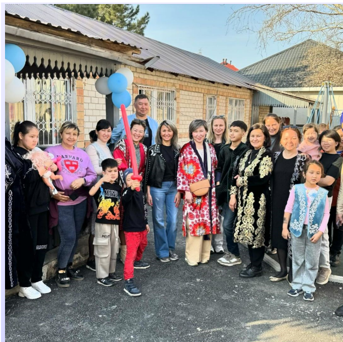
На фото, дети и их родные в реабилитационном семейном доме.

Расширение спектра предлагаемых услуг для детей с особыми потребностями и их семей.