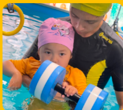
Samruk-Kazyna Trust " мүмкіндігі шектеулі балаларға арналған бассейнін орнату (орал қаласы, 2022 жыл)