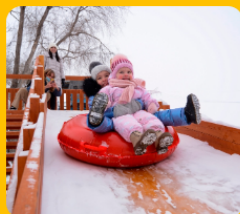
Бқо-да балаларға арналған қысқы сырғанақ орнату (2018 жыл)