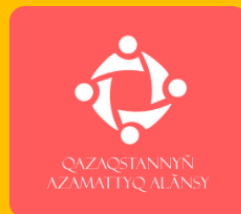
Қоғамдық бақылау грант қоғамдық альянс