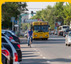
Бқо қауіпсіз жолдары (ақсай қаласы, 2021 жыл)